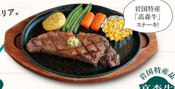
岩国特産 「高森牛」 ステーキ!

飛行機や電車までの時間にちょっと周れるエリア。 実は、新鮮な魚、肉、野菜が食べられる スポットでもあるんです!