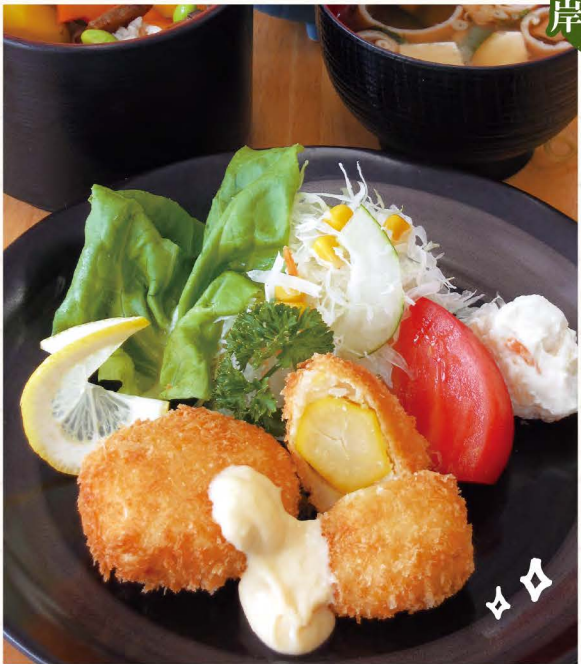
岸根栗コロッケ定食 950円

16 レイクプラザやさか 美和町の特産「岸根栗」を丸ごと使ったコロッケ。10/1~31「岸根栗フェア」開催中の限定です。 岩国市美和町百合谷281-2 ☎0827-96-0569 営/8:30~17:30(16:00 O.S.) 休/火曜(祝日は営業) http://www.sea.icn-tv.ne.jp/~yasakac/ 🚗 錦帯橋から車で約25分