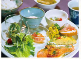
日替わりランチ 980円 ※平日のみ

岩国市周東町祖生7253-1 ☎0827-85-0685 営/10:00~18:00 (木曜のみ17:00まで) 休/月・火曜