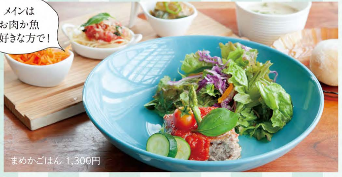
メインは お肉か魚 お好きな方で!