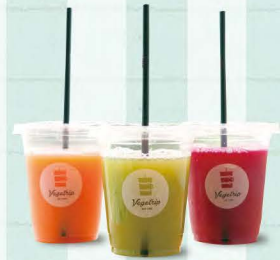
本日のコールドプレスジュース 540円〜

50年間、旬の野菜や果物を取り扱ってきた青果店が作るジュースは、余計なものを一切使わず、サラッとした口当たり。スツと身体に沁みわたります。