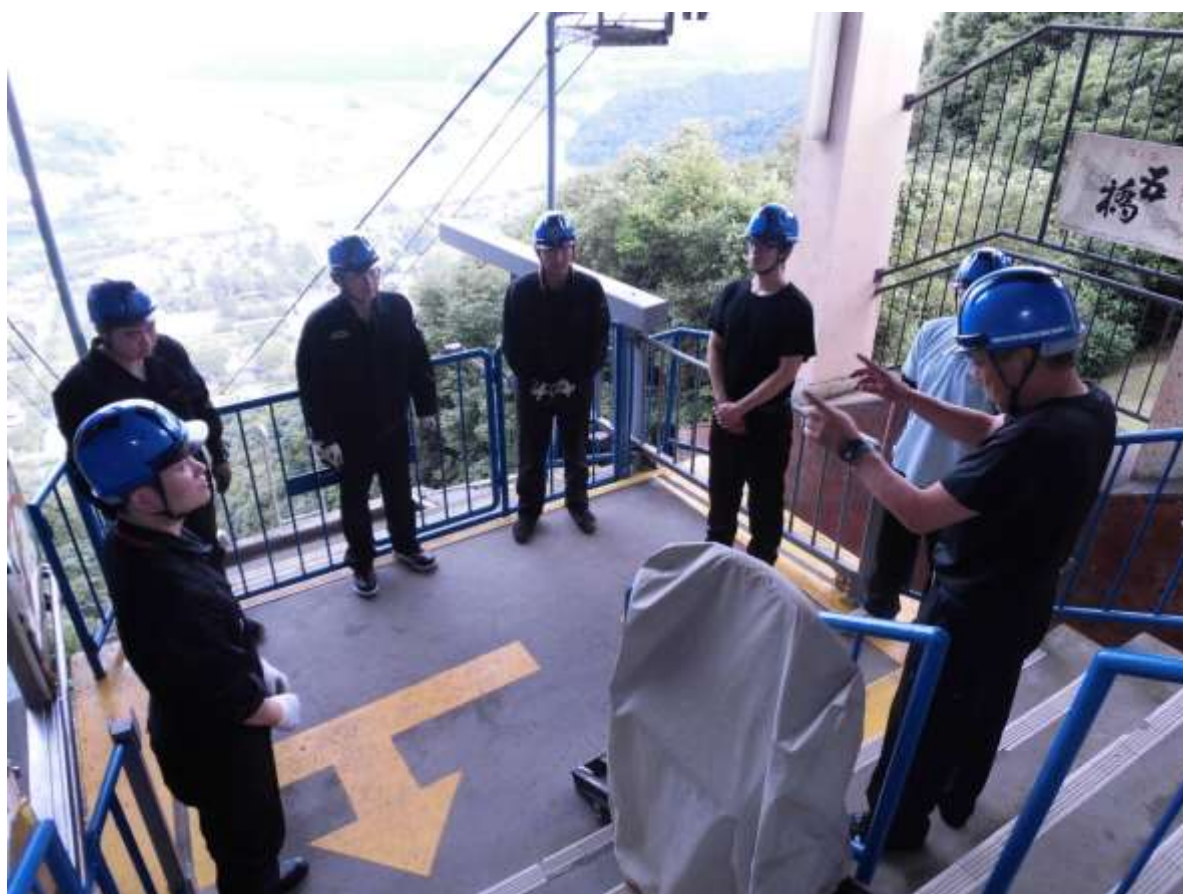
<平成 28 年 6 月 30 日 岩国城ロープウェー救助訓練の様相>